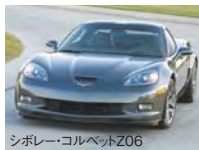
シボレー・コルベツトZ06

この場を借りて一つお伝えしたいのが、プレミアムブランド戦略の一翼を担うサブについて