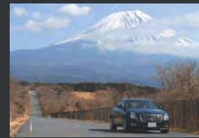
富士宮方面からの富士山の雄姿。方角や高度により刻々と変化する姿を周囲から眺めるのもいい。

それは、富士山に抱いていた美しき霊峰のイメージを、ミステリアスに変えてしまっただけだった。中央自動車道を、大月ジャンクション経由で真っすぐ富士山に向かってクルマを走らせる。花咲トンネルを抜けてしばらく進むと、視界は徐々にぼやかり、富士山の麓姿で占められる。河口湖インターチェンジを降り、国道139号を西へ。待ちきれない思いで西湖の湖畔にクルマを止め、まぶしい銀雪を頂くダイナミックな富士山の眺めにしばし見とれる。静寂をたえた湖面には、幸運にもあてやかに「逆さ富士」が映し出されていた。