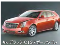
キャデラック・CTSスポーツワゴン

次に日本市場について語りましょう。GMは一九五五年に日本で販売開始して以来、九十一年を超えて長い歴史を誇ります。その足跡を踏まえ私たちが、〇六年後半から高級車に特化した「プレミアムブランド戦略」を展開してきました。この戦略は二年間の実績を見ると成功を収めていますし、販売の最前線にも浸透してきています。