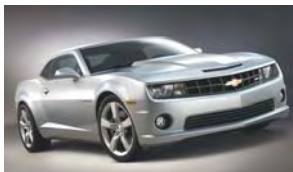
シボレー・カマロ

GMにしては、これまで興味を示されなかった新しいお客様に注目され、購入されているという点で画期的なモデルといえます。特に、世代を問わず多くの方にGM車を知っていただく上で、今後重要なモデルの一つと位置づけています。