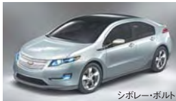
シボレー・ボルト

アメリカ車というイメージに品質も燃費も悪く大きく劣るといイメージを持たれている方が多いようです。今回GM再建にかかわる論評のなかでも、七〇年代や八〇年代の印象で語っている傾向を見受けるところもありました。したがってお客様には、ぜひGMのシボレー・コルベツトにぜひ乗っていただき、GM車を実際にご覧になり、乗って運転していただきたいのです。そのイメージが過去のものに過ぎないと、立ちどころに実感いただけるでしょう。私たちがいま、キャラバンを組んで試乗車を日本中のディーラーに展開していますので、お客様にもぜひお近く